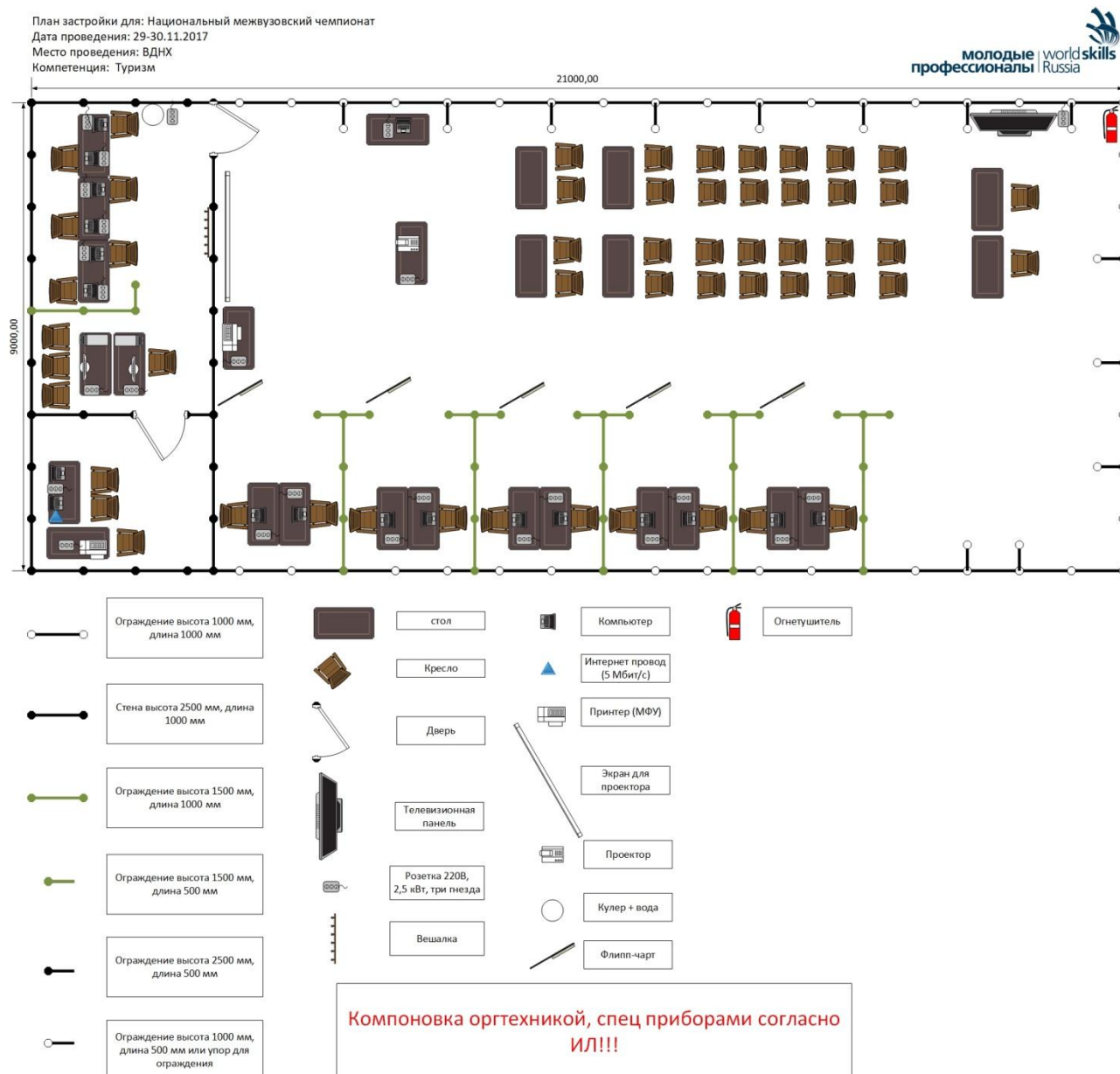
Схема конкурсной площадки